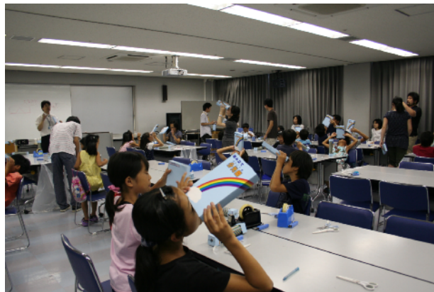
写真11. 分光器で蛍光灯を観察する参加者

「組み立て分光器」の工作についても、『虹でしらべよう！「光の正体をさぐる」』と同じものであるため、2章3節を参照されたい。