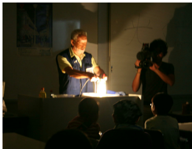
写真9. クリップ/エンピツ灯の実験

前の実験では、エンピツの芯が光るフィラメントの働きをする為、もはや備長炭は電極の単なる棒となり、これをクリップまたは針金に代用し、これらを固定する装置としてガラス瓶を用いた。