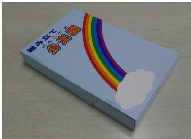
写真4. 完成した「組み立て分光器」