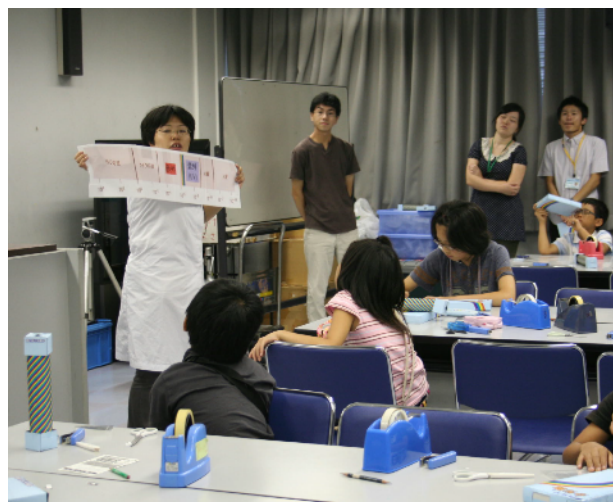
写真7. 可視光線・赤外線・紫外線の説明

以前に行った実験ショーでは見えない光のみを扱ったため、始まりが光についての基礎的な説明から始めざるをえず、冒頭のつかみが弱くなるという問題があった。しかしながら、本教室のように、さまざまな光源のスペクトルの観察を行うなど可視光領域の話題と組み合わせることで、可視光から始まり、可視領域外の光へとスムーズに展開しながら光全体を扱うこと可能となった。実験の最後に参加者へ見えない光を認識することが出来たかと質問してみたところ、認識できたとの声が上がリ、実験を通して目には見えない光の存在を認識するという本セクションの目標は達成できたものと思われる。