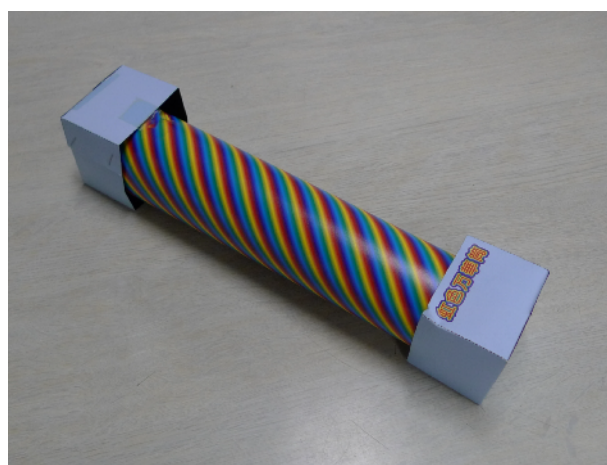
写真2. 完成した「虹色万華筒」

とくらべ遮光性が高い分美しく見え、参加者は完成したという達成感もあり、夢中になって覗いていた。