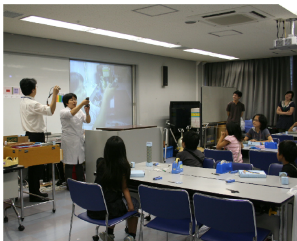
写真6. ビデオカメラを用いて、赤外線を可視化する

まず、赤外線通信を行うリモコンを操作しながらビデオカメラで撮影し、肉眼とカメラ映像とで比較を行った。肉眼では赤外線を認識できないことを確認するとともに、カメラ映像では通信時にリモコンの送信部が点滅している様子を観察し、今回用いたビデオカメラが赤外領域の光も捉えられることを確認した。