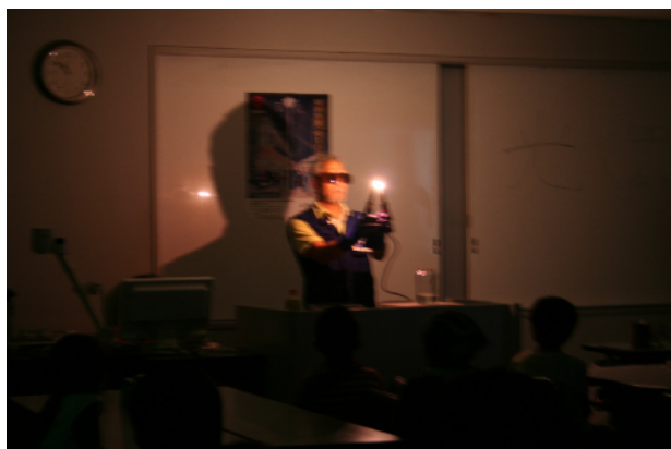
写真8. アーク灯の実験

二本の備長炭(電極)、ヘアードライヤー(安定器)、ブースターケーブル(自家用車のもの)、電源として家庭用の交流100Vにこれらを接続すれば、二本の備長炭の間にアーク(円弧)の光が輝く。