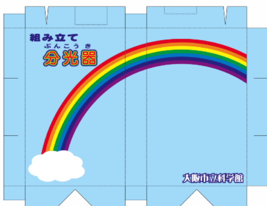
写真3. 「組み立て分光器」の型紙

回折格子レプリカフィルムだけの場合と見えるスペクトルは同じである。しかし、この分光器を用いて蛍光灯のスペクトルを観察してもらい、435 (nm)あたりに青い線が…などと具体的な数字をあげて紹介すると、漫然とスペクトルを見ていた時とは反応が変わった。ただ、工作精度により、±10nm程度の誤差が出た。