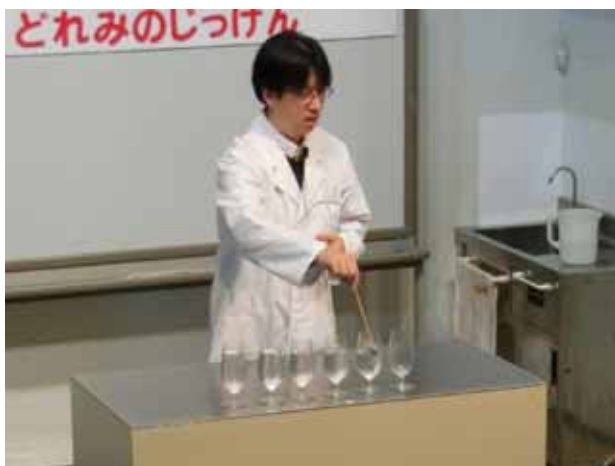
写真8. 水の量が多い順に並べたグラス