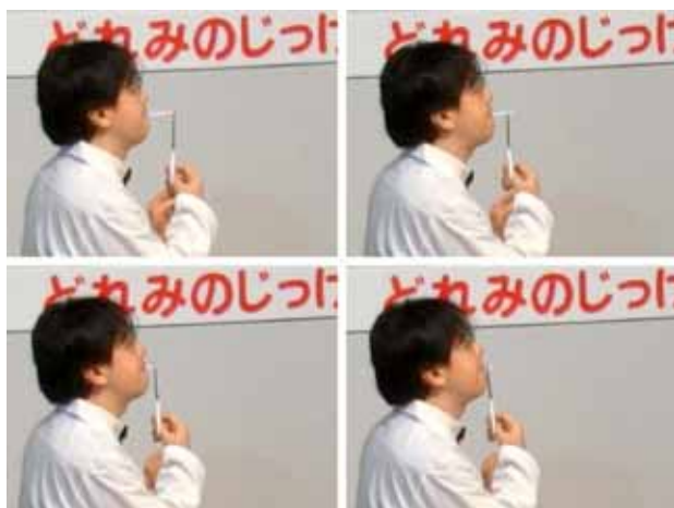
写真6. 吹きながらストローを切ると高い音に