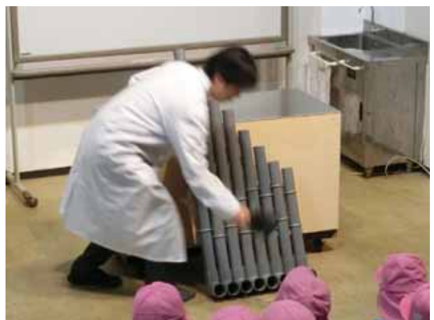
写真3. 「ドレミのパイプ」

次に、塩化ビニルパイプの水道管用のパイプ8本で「ド・レ・ミ・ファ・ソ・ラ・シ・ド」の音が鳴るように作ったものを用意した。これは、吹いたり叩いたりするよりも、靴等でパイプの先を叩くと大きな音が鳴る。これと同様のパイプは、「ドレミのパイプ」という名称で、展示場2階にも設置している。