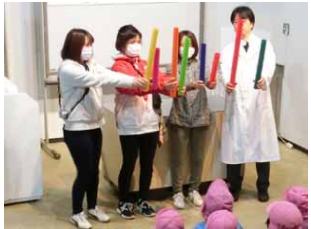
写真2. パイプを長さの順に並べる パイプはランダムに取り出しているため、長さはバラバラであるが、これを長い順に並べる

使用したパイプは市販のもので、8本で「ド・レ・ミ・ファ・ソ・ラ・シ・ド」の1オクターブの音が出るものである。2本の「ド」は赤色、「レ」はオレンジ色、「ミ」は黄色...とそれぞれ色も変えてあるため、「音だけでなく、他に何が違うでしょう?」という問いかけに、「色」という回答も時々あった。しかし、長さの順に並べていく時には、「次はどれが長い?」といった問いかけに「黄色!」というように色で答えることができるため、同じ色よりもやりやすかった。