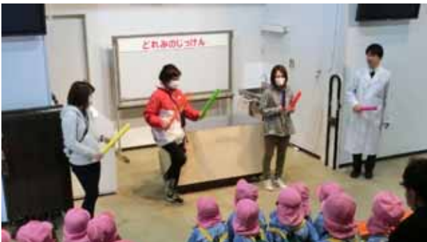
写真1. いろいろな長さのパイプを叩いて音を鳴らす

まずパイプを1本取り出し、「今日は音の実験なので、どうしたら音がでるでしょうか?」と問いかけ、パイプを手で叩いたり、パイプで膝や頭などを叩いて音を出した。引率の先生(保育士、以下先生と表記)に出てきていただき、このパイプを渡す。また別のパイプを取り出し、同じように叩くと先のパイプとは違う音がするのを確認して、このパイプも先生に渡す。同様に別のパイプを取り出しては叩き...を繰り返して、全部で8本のパイプを4人で2本ずつ持つ。