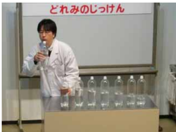
写真10 . 水の量が多い順に並べたペットボトル この状態で向かって左側から順に吹くと、 「ド・シ・ラ・ソ・ファ・ミ・レド」となる