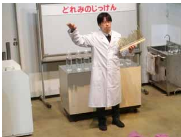
写真11 . 落とすだけで演奏できるバンジーチャイム

最後に、いろいろな長さの真鍮製のパイプを用意した。これは「バンジーチャイム」という名称で市販されているもので、吹いたり叩いたりするのではなく、床に落とすことできれいな音が鳴るようになっている。また、一見長さがバラバラであるように見えるが、端から順に落としていくことにより、曲になるように作ってある。但し、今回の幼児団体向けのサイエンスショーでは、順番に落とすと童謡になるものを自作した方がよかったように思われる。