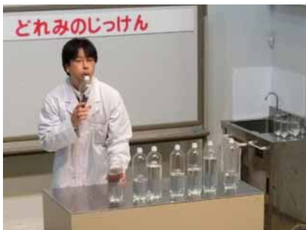
写真9 . 水が入ったペットボトルを吹く

しかし、水の入ったペットボトルを吹く場合、先ほどの水の入ったグラスとは逆に、水の量が多い方が高い音、少ない方が低い音となる。これは水面より上の空洞の部分で音が共鳴するからであり、この空間が広い方が低い音となる。ただ、幼児に対してはこのような説明は行わず、単に「今度は水の少ない方からド・レ・ミ・ファ・ソ・ラ・シドになっている」ということだけにとどめた。