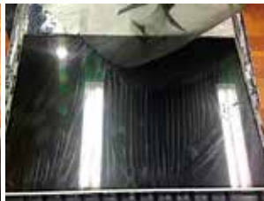
写真6. 全部剥がした状態