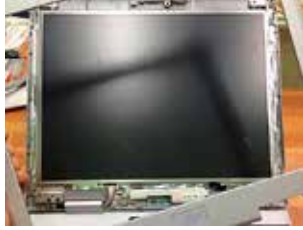
写真3. やっと枠が外れる

す。このとき、無理を するとツメを折ってし まうので、何ヶ所かに ドライバーを差し込ん で、少しずつ隙間を拡 げていきます。どうし ても隙間が広がらな いところがあれば、まだ