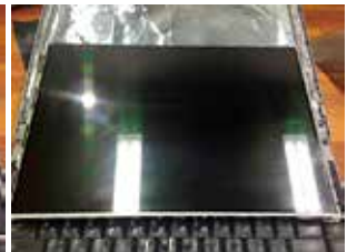
写真7. パネルをきれいにする