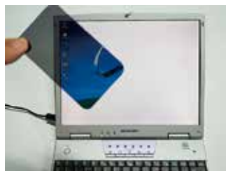
写真1. 画面の見えないパソコン

そこでサイエンスショーの道具の中には、偏光板を剥がしたノートパソコンや掛け時計が入っています。これらはそのままでは表示が見えないのですが、偏光板を通すと画面や時刻を見ることができます。出張サイエンスショーでは「家のパソコンやテレビから偏光板を剥がしたらあかんで」と言っているのですが、それではこのサイエンスショーの道具はどうやって作ったのでしょうか。そこで今回は、どのようにして