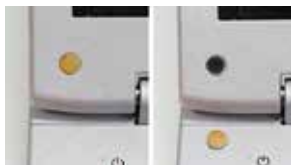
写真2. 隠してあるネジ

ネジを外したら、部品の間隙にマイナスドライバー等を差し込んで、はめ込み部分を外していきま