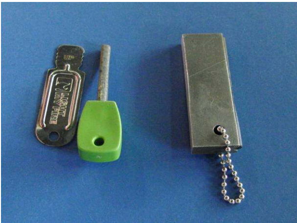
写真7. ファイヤースチールスカウト(左)とファイヤースターター(右)。 ファイヤースチールスカウトは、附属の金属片で擦り、火花を散らす。ファイヤースターターは本体右側のマグネシウム部分をカッターで削り、ティッシュや枯葉の上にのせる。その後、カッターなどで本体から火花を散らし着火させる。

ただし、商品名「ファイヤースターター」「ファイヤースチールスカウト」などと呼ばれる登山・キャンプ用品がこのプリントを使った非常用の発火用道具として販売されており、そちらで代用することができる。