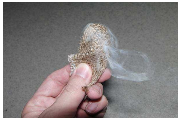
写真5. テルテル坊主のように火種をくるみ、腕をゆっくと振り回すと煙が出てくる。