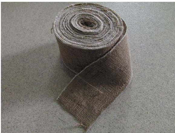
写真1. 使用した麻のシート。ホームセンターで1巻き、500円程度で販売している。

これまで本燃焼に関わるサイエンスショーを何度か行ってきたが、それまでと大きく変わったのは、まいぎり式火起こし器による発火である。以前は、木の削りかすの中に赤い火種ができる程度であったものを、ホームセンター等で販売している麻布シートの中にくるみ、振り回すことで発火させることができるようになった。この実験によって本当に木を擦るだけで、つまり、摩擦熱により発火させることができるということが、見学者の本サイエンスショーに対する関心をより高めることができるようになった。