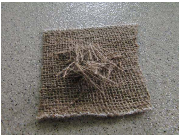
写真2. 約10cm 四方程度に切り取り、さらにほぐした麻シートを少し積む