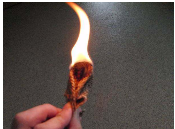
写真6. 振り回している、このように燃え出す。