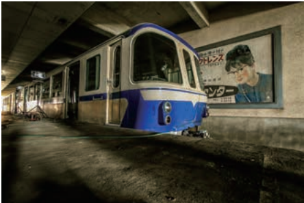
写真5. 姫路市営モノレール

姫路市営モノレールは1966年に開催された姫路城の昭和の大修理完了を記念して開催された「姫路大博覧会」への交通手段としてつくられました。姫路駅～会場となる手柄山までの約1.6キロをつないでおり、総工費は14億5千万円、8ヶ月の工期を要して開業されました。