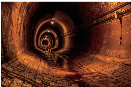
写真1. 湊川隧道の入り口通路とその内部