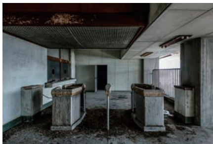
写真7. 大將軍駅改札