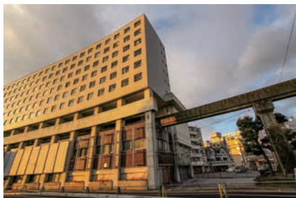
写真6. 大將軍駅外観

当時、夢の乗り物と呼ばれていた姫路市営モノレール。わずか8年という短い間しか走ることができなかったが、これからは姫路の歴史を伝える貴重な遺産として愛され続けてほしいと思います。