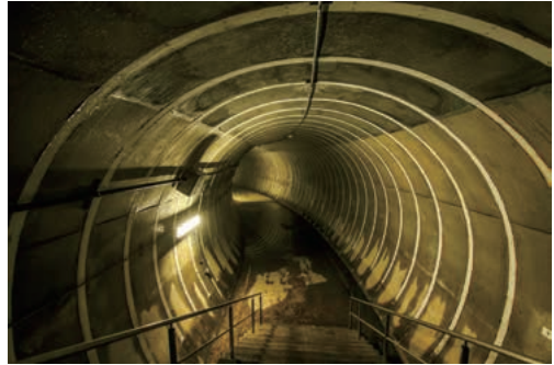
写真2. 湊川隧道の転流坑

その後、約100年という長い間、河川トンネルとして活躍してきた湊川隧道でしたが、水害や阪神淡路大震災の影響などで新たに「新湊川トンネル」が作られた事により、2000年にそのバトンを手渡すこととなりました。役目を終えた後は、地域の方たちの保存活用したいという熱い思いにより「湊川隧道保存友の会」が平成13年に発足。現在