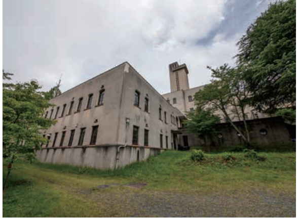
写真3. 京都大学阿武山地震観測所外観

この建物ができたのは1930年。1927年にマグニチュード7.3の北丹後地震が発生したことがきっかけで、地震の研究をするために建てられました。