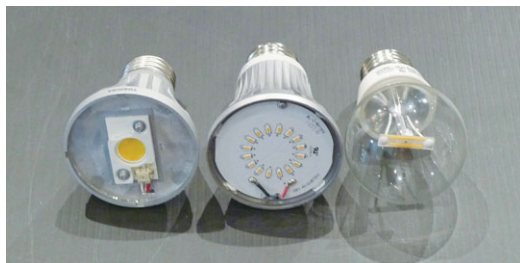
写真3 電球型LEDの内部 (黄色いのが蛍光物質をかぶせたLED)

では、電球型LEDのスペクトルを白熱電球や電球型の蛍光灯と比べると、どう違うでしょう。一番上の白熱電球は、赤から青まで全ての光を出しているの、のっぺりとしたスペクトルになっています。まん中の電球型蛍光灯は、いくつかの色だけを出しているの、色違いの電球が並んでいるようなスペクトルになっています。一番下の電球型LEDは白熱電球のスペクトルに似ていますが、よく見ると緑と青の間がやや暗くなっているのがわかるでしょうか。これは、青色LEDが出している青色の光と、蛍光物質が出している赤～緑色の光で光っているために、青と緑の間が抜けているからなのです。