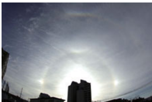
写真1 小さな氷の粒によるさまざまな現象

学現象をよく紹介していますが、水滴で見える虹と比べると、小さな氷の粒で見える現象はいろいろあります。太陽から横に22度くらい離れたところに虹のかけらのようなものが見える「幻日」、太陽を中心に半径約22度の円形をした「暈」、暈の上の部分に太陽中心の円ではない形になる「タンジェントアーク」、太陽の上の方に逆さまになった虹のように見える「環天頂アーク」など…。