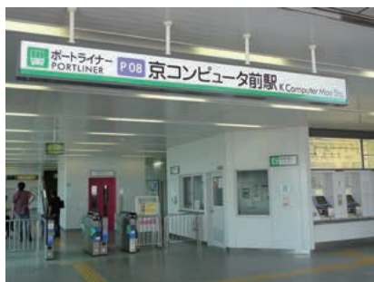
写真1. ポートライナー「京コンピュータ前」駅

計算科学研究機構でも、1階で「京」のシステムラックやシステムボード、CPUなどの展示の他、ミニ講演会や実験ブースがあり、そしてエレベーターで5階へ上がって実際に「京」を見ることもできます。ただ、「京」のシステ