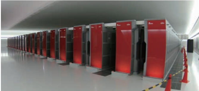
写真4. 見学者ホールからは見られない角度からの「京」